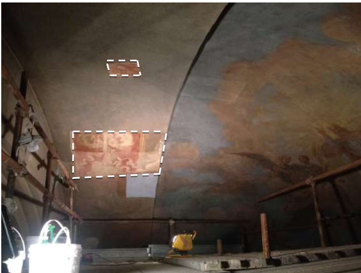
DURANTE IL RESTAURO - prima del discialbo sono state realizzate alcuni saggi per testare l'effettivo stato di conservazione del film pittorico originale