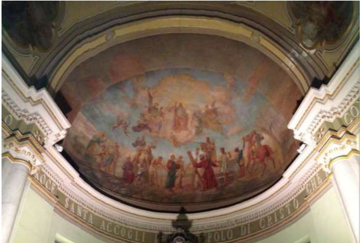
ANTE RESTAURO – il fascione dell'arco è interamente coperto da ridipintura monocroma