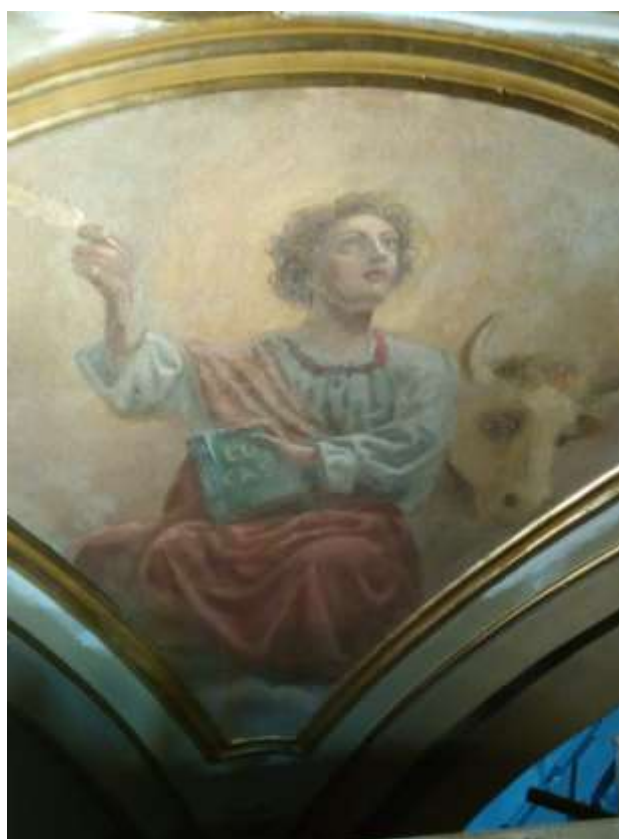
Uno dei pennacchi S. Luca Evangelista ANTE RESTAURO