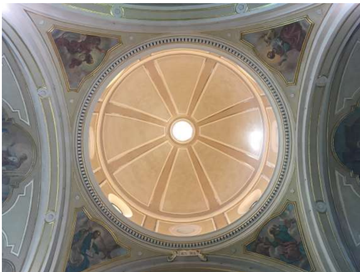
Vista generale della cupola POST RESTAURO con il recupero delle riquadrature degli spicchi