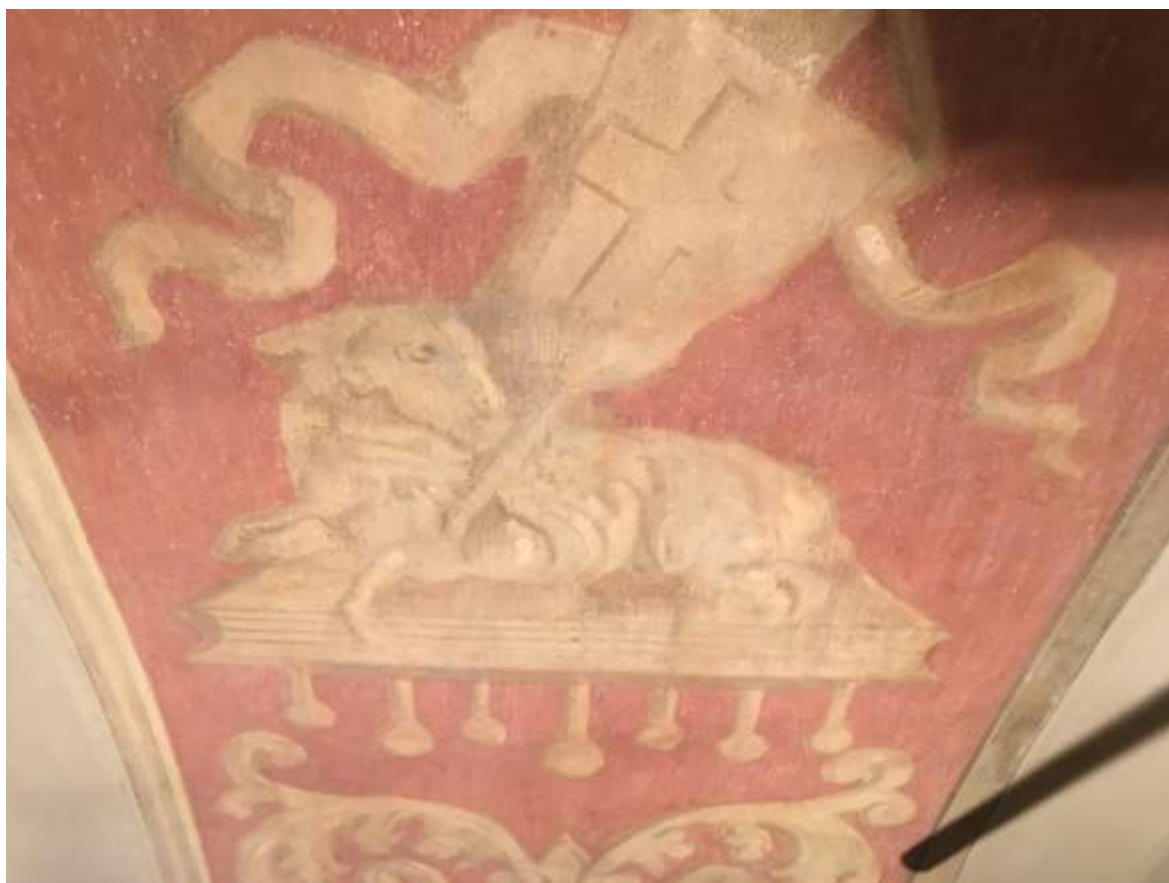
DOPO IL RESTAURO – un dettaglio della figura dell'agnello integrata con ritocco pittorico a rigatino eseguito ad acquarello