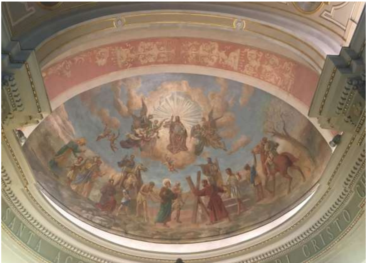
POST RESTAURO – recupero quasi totale della decorazione a motivi a candelabra della fascia