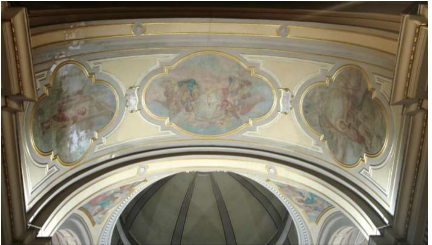
ANTE RESTAURO – Volta Presbiterio