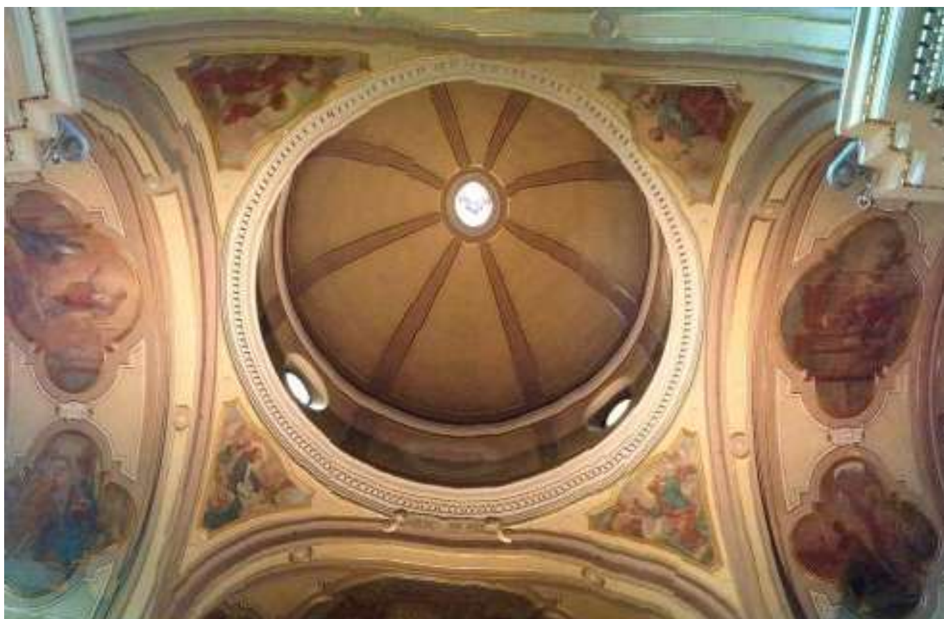
Vista generale della cupola ANTE RESTAURO