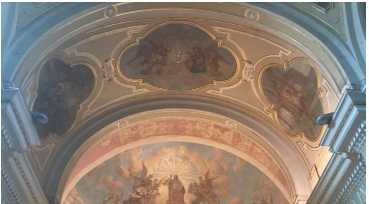
POST RESTAURO – Volta Presbiterio